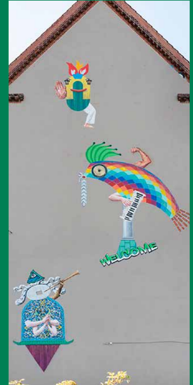
Titel: Forenede Fasaner. Parade og gavlmaleri. År: 2016-2018.

I den borgerinddragende parade Forenede Fasaner inviterede J&K forskellige foreninger og samfund på Nordre Fasanvej til at skabe en fælles vandring gennem området, hvor de præsenterede sig for hinanden og for omverdenen. Plakaten og det efterfølgende murmaleri koblede på samme vis artefakter og symboler fra de forskellige foreninger. På lignende vis kan foreninger møde hinanden i en folkelig performance, faciliteret af en kunstner.