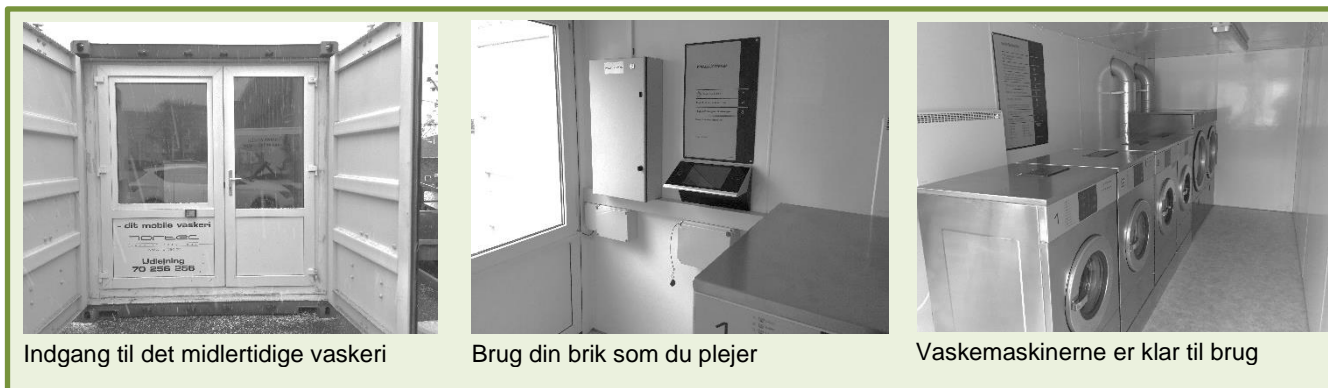
Indgang til det midlertidige vaskeri

Når der er sat hegn om prøveblokken kan du ikke bruge vaskeriet i nummer 19. Fra august skal du i stedet bruge det midlertidige vaskeri, der stilles op som erstatning. Det midlertidige vaskeri laves i en container, som står ved Taastrupgårdsvej 17. I det midlertidige vaskeri skal du bruge din brik når du vasker, så registreres forbruget og du betaler over din husleje – præcis som du kender det fra vaskeriet i nummer 19.